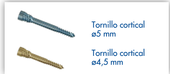
Tornillo cortical ø5 mm