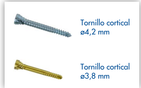
Tornillo cortical ø4,2 mm