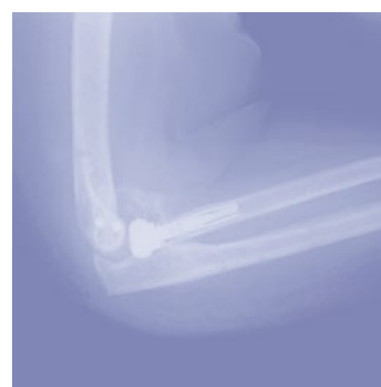
Remoción del fijador